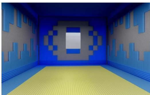
国际首例超结构全消声室